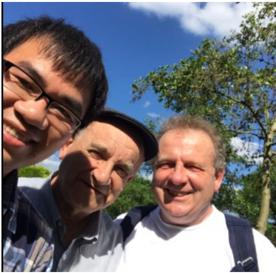
dal bar della Missione cattolica italiana.