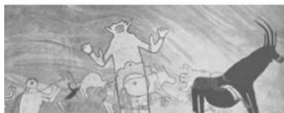
Sefar (deserto del Tassili, Nord Africa 7° millennio a.C. Scena di adorazione di personaggi femminili verso un grande personaggio maschile

È stata la prima esperienza della scrittura, quando questa non conosceva ancora gli ideogrammi, ma ne presagiva il valore e faceva i suoi primi tentativi per esprimere quello che è chiamato sacro , talvolta con sufficienza, talvolta con sussiego, ma che in realtà è ciò di cui siamo anche impastati.